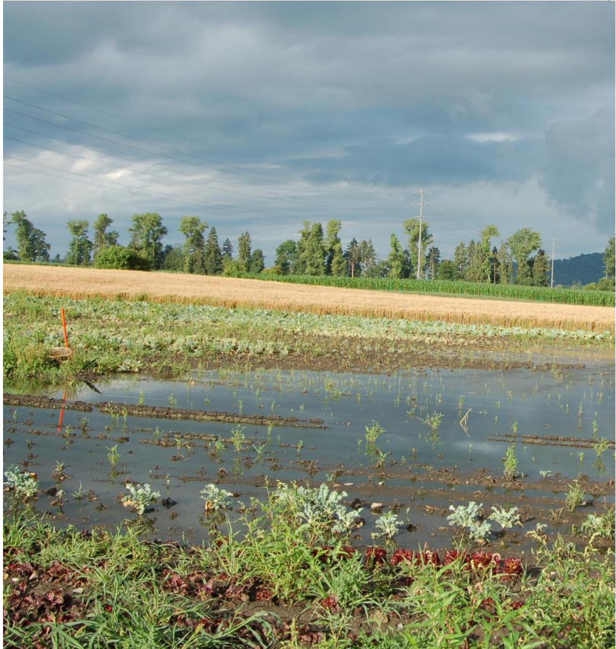
Sowohl die Entwässerung, wie auch die Bewässerung sollen bei extremen Witterungsereignissen verbessert werden.